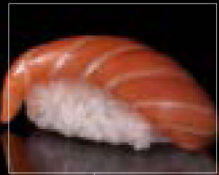
Nigiri Sushi : Består av en liten kulle ris, toppad med antingen rå eller tillagad fisk eller skaldjur