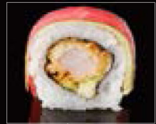
Uramaki Sushi : Sushirulle med olika fyllningar som rullas inuti riset.