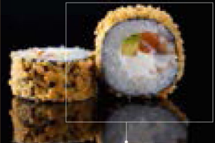
Crunchy roll : Friterad sushirulle som får en krispig smak